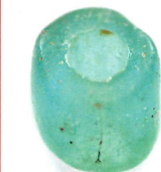
ガラス小玉(ブルー)